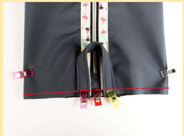
18. poutko upevníme ke zkracované straně zipu, přišpendlíme. Prošijeme celý okraj ("vtlačené" okraje i poutko) a okraj zastříhneme na cca 3mm podél šití