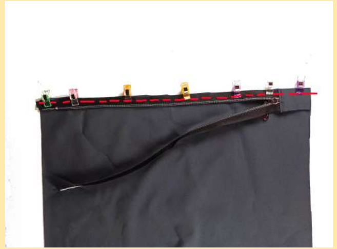
6. přišijeme zip na kratší stranu obdélníku látky - zip i látku otočím lícem k sobě, prošívám po rubové straně, zoubky zipu směřují od kraje dolů