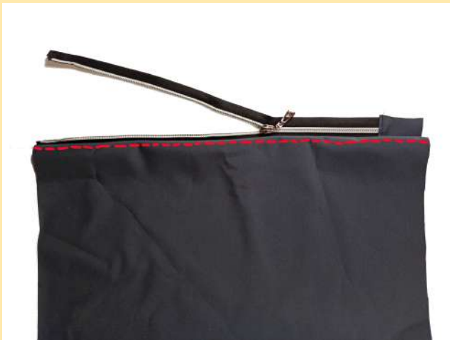
7. přišitý zip překlopím na lícovou stranu a prošiju znovu po lícové straně