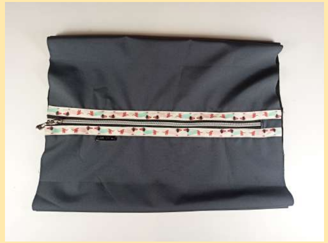
16. pouzdro otočíme zpět na lícovou stranu a opět srovnáme středy (zip+dno), středy sešpendlíme