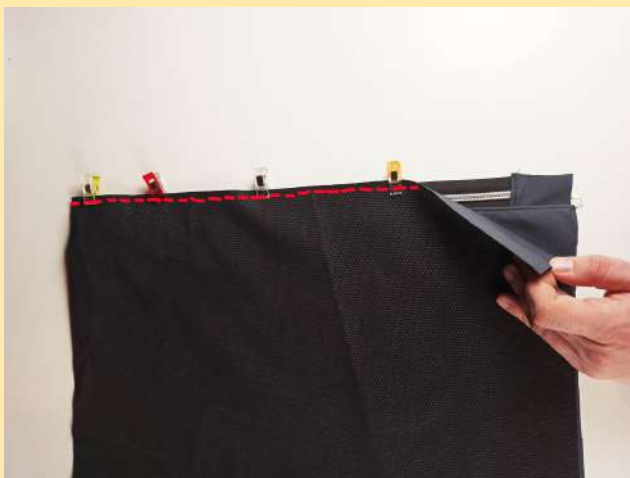
9. Druhý konec obdélníku přišpendlím k druhé straně zipu (líc látky na lícovou stranu zipu) a prošiju