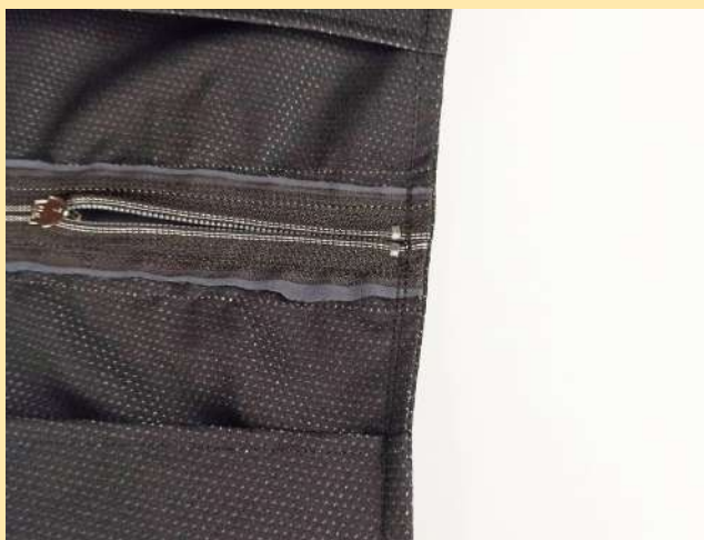
21. hotovo-prošito z rubu