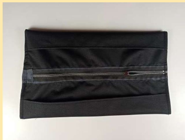
22. prošito z obou stran. Můžeme pouzdro otočit na líčovou stranu. HOTOVO :).