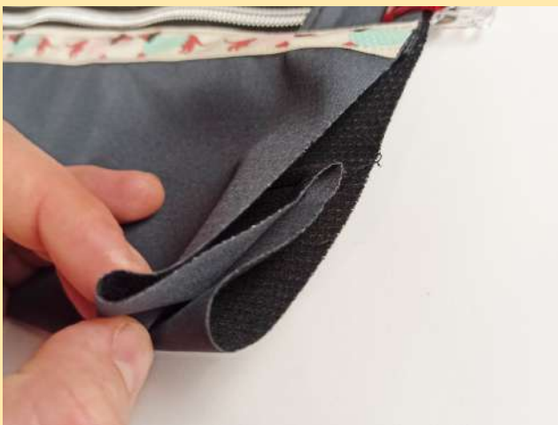
17. boční kraje "vtlačíme" dovnitř pouzdra (díky pomocnému prošití boků to jde snadno), zašpendlíme po kraji, "vtlačíme" na obou stranách pouzdra