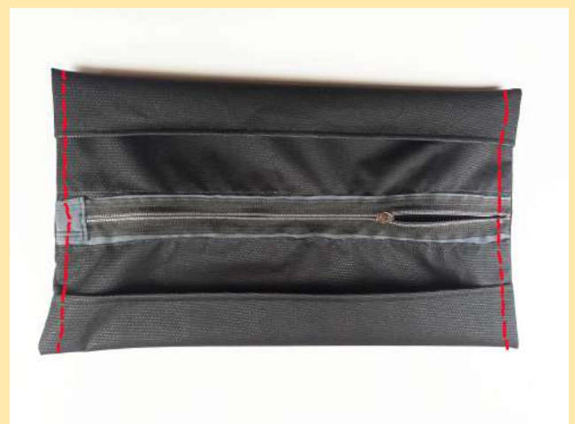
20. otočíme na rub pouzdra, sklady se překlopí na jednu stranu, srovnáme hlavně v rozích. Prošijeme boky 1cm od okraje (francouzský šev - schováme do něj 3mm nezapravený šev z lícové strany, tedy šijeme raději víc jak 1cm)