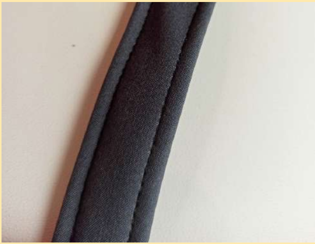
15. prošijeme po obou stranách a máme hotové poutko