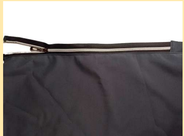
8. prošitý zip by měl vypadat takhle