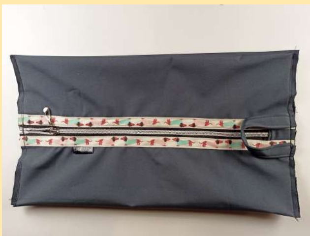
19. zopakujeme na druhé straně. Máme prošité obě boční strany, vtlačené boky vytvořily sklad po celé boční délce.