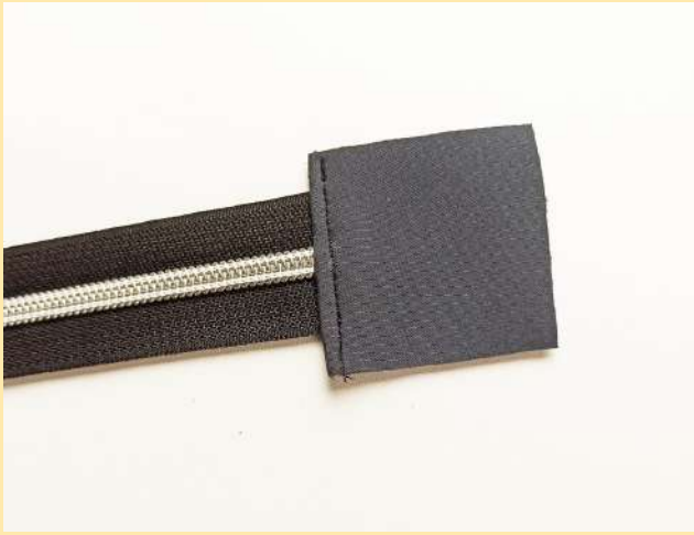
5. hotový zip