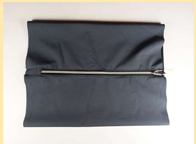
10. otočím na lícovou stranu, rozepnu zip a zase prošiju kolem zipu z lícové strany. A máme přišitý zip!